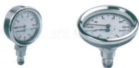
Termo-manómetro con vaina 1/2