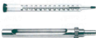
Termómetro vaina vertical c/ alma cristal