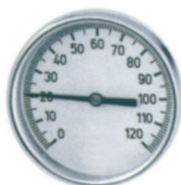
Termómetro abrazadera 0-120° para tubería